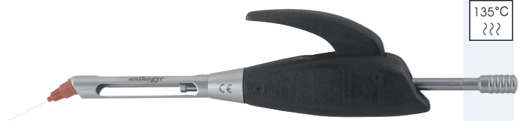
Réf. 2300 MINIJECT