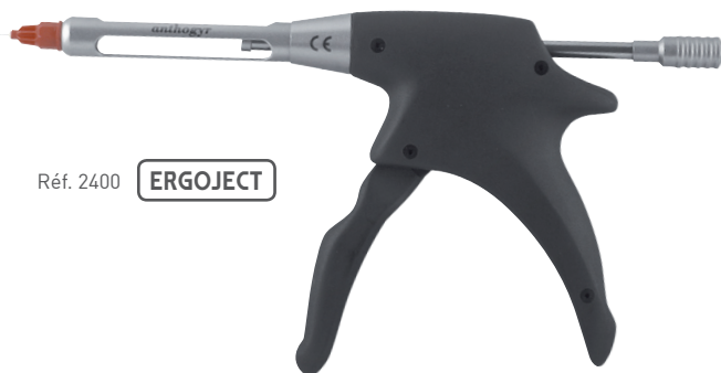
Réf. 2400 ERGOJECT

Seringues ergonomiques et techniques dédiées, en particulier, aux anesthésies intraligamentaires et intraseptales.