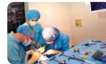
Chirurgies en direct