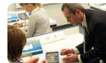
Salle de travaux pratiques