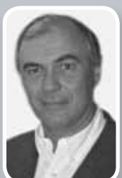
Pr Pierre BRETON